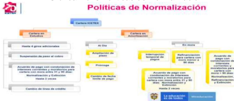
Gráfica No. 3 Políticas de Normalización

“(…) 6. Desde marzo de 2020 se ha evidenciado el impacto de la pandemia por Covid-19 dado el deterioro sin precedentes del mercado laboral colombiano, tanto por su rapidez como por su magnitud. Alrededor de una cuarta parte del empleo, previo a la crisis, se destruyó en 2020, y si bien se ha presentado un leve repunte de la ocupación, sus caídas anuales siguen superando el 20%.” (…)