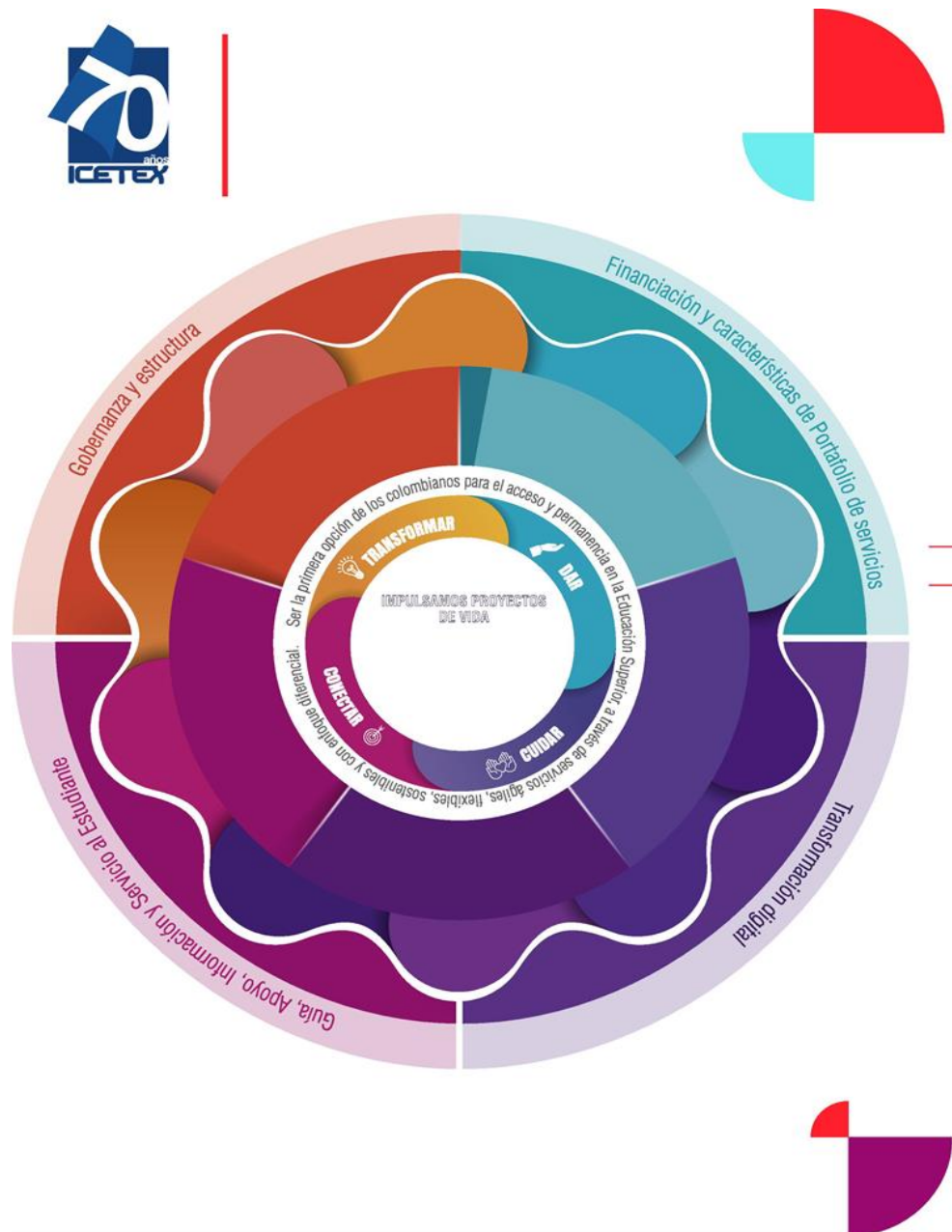
Figura No. 1 Mándala Estratégica

La mándala estratégica en ICETEX se establece como la representación gráfica de la estrategia institucional. Nace como respuesta a la necesidad de dar a conocer y promover, al interior de la entidad y a los grupos de valor, el plan estratégico; de manera sencilla, clara y en una sola imagen. La Mándala se encuentra desplegado en niveles, que a su vez se pueden clasificar en tres partes: