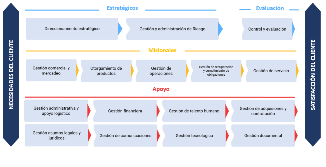
Ilustración 2 Mapa de procesos del ICETEX.

Procesos de Apoyo: Corresponden a los procesos que brindan soporte a la realización del producto o prestación del servicio.