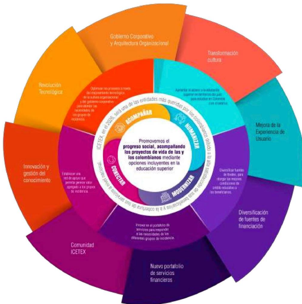
Ilustración 2 Mándala Estratégica.

La Mandela Estratégica en ICETEX se establece como la representación gráfica de la Estrategia de la entidad. Nace como respuesta de la entidad de promover al interior de la entidad y a los grupos de valor el plan estratégico, de manera sencilla, clara y en una sola imagen.