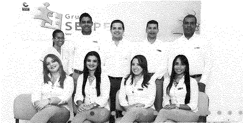
Equipo de Trabajo Sede Valledupar