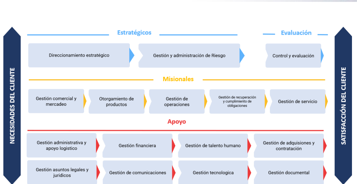
Ilustración 3 Mapa de procesos del ICETEX

Procesos de Apoyo: Corresponden a los procesos que brindan soporte a la realización del producto o prestación del servicio.