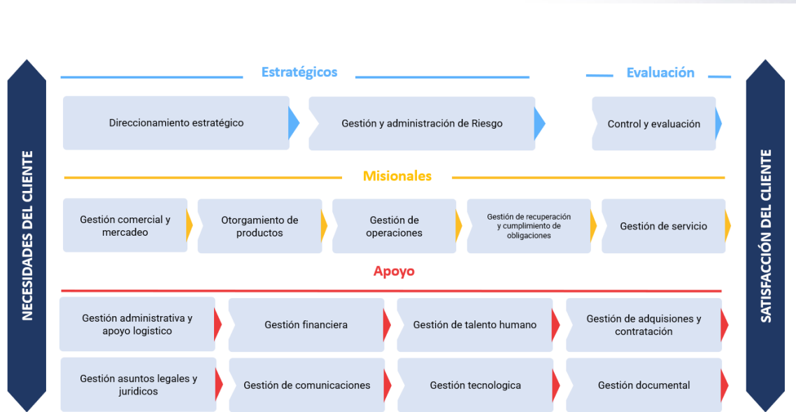
Figura 1 Mapa de procesos del ICETEX.

Procesos de Apoyo: Corresponden a los procesos que brindan soporte a la realización del producto o prestación del servicio.