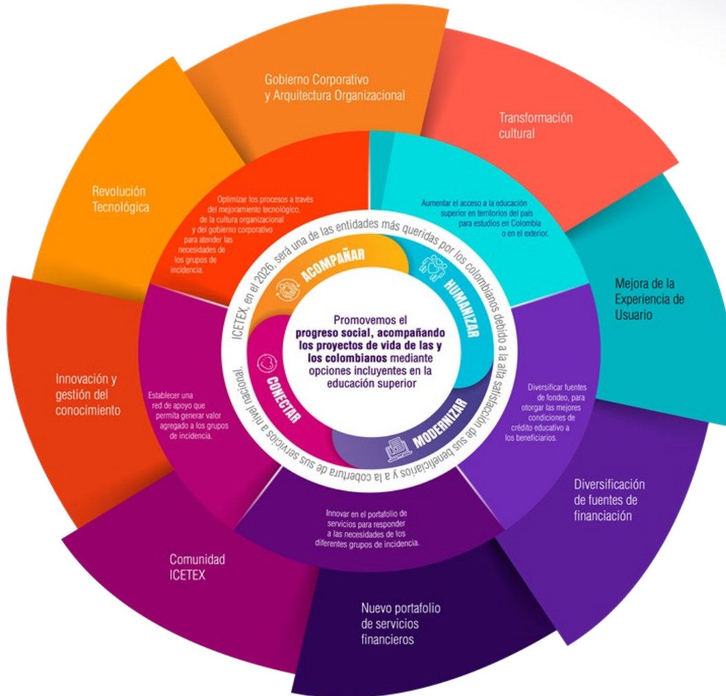
Ilustración 1Mándala Estratégica.

Este plan se concibe a través de una representación gráfica denominada "Mándala Estratégica". Esta figura se origina a partir del propósito superior de la entidad y se expande para incluir los componentes estratégicos derivados, que constan de cuatro lineamientos estratégicos, un enunciado de visión, los objetivos estratégicos definidos y la lista de programas que componen el portafolio estratégico de la entidad durante el cuatrienio de vigencia del Plan.