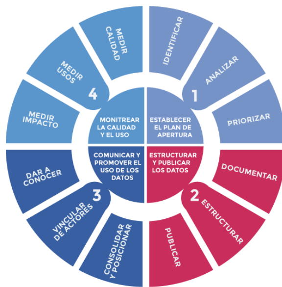
Ilustración 1 Ciclo de Vida de los Datos.

Entender el valor de los datos y su impacto sobre el crecimiento es fundamental para generar iniciativas que permitan a la entidad a diversificar productos y hacer más eficiente la toma de decisiones. Para esto ICETEX ha implementado el procedimiento de datos abiertos siguiendo el ciclo de Datos el cual se muestra a continuación: