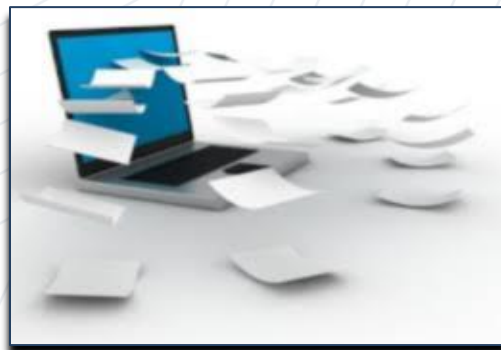
Imagen No .1

La política de Gestión Documental del ICETEX está conformada por el Programa de Gestión Documental PGD, los procedimientos de Gestión documental, las Tablas de Retención Documental y los demás lineamientos relacionados en circulares y guías establecidos por la entidad en torno a la Gestión Documental.