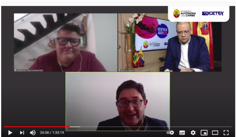
Imagen 1 Invitados especiales