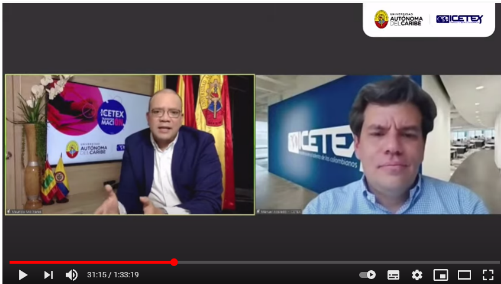
Imagen 2 Invitados especiales

Impulsamos proyectos de vida brindando las mejores alternativas para crear caminos incluyentes en la educación superior