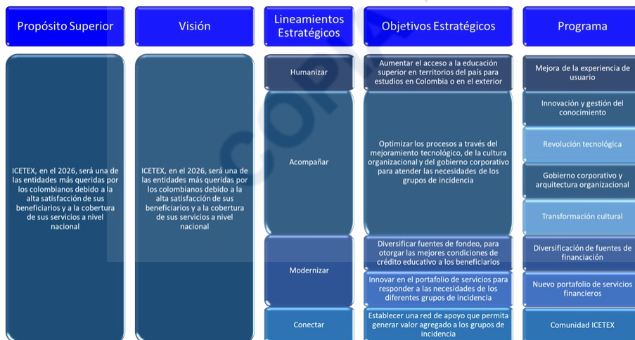
Figura 1. Alineación estratégica de la entidad.

Así entonces, los componentes a continuación descritos plasman la hoja de ruta que orientarán la marcha de la entidad, con la finalidad de afianzar su gestión durante los próximos cuatro años (2023 – 2026), son: