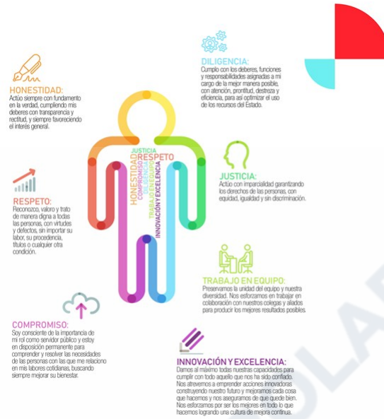
Figura 2. Valores institucionales ICETEX