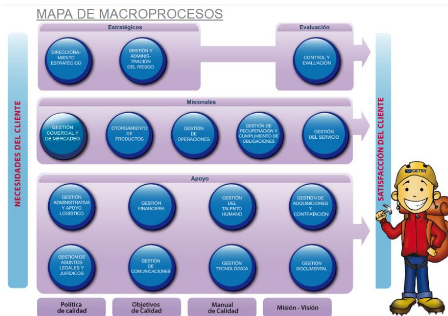
Gráfico 2: Mapa de Macroprocesos del ICETEX

De acuerdo con la arquitectura de procesos, el Icetex ha definido 5 macroprocesos misionales para satisfacer las necesidades de los clientes, 8 macroprocesos para soportar la ejecución de los procesos misionales, 2 macroprocesos estratégicos y uno (1) de evaluación. Dichos procesos se muestran en el gráfico 1.