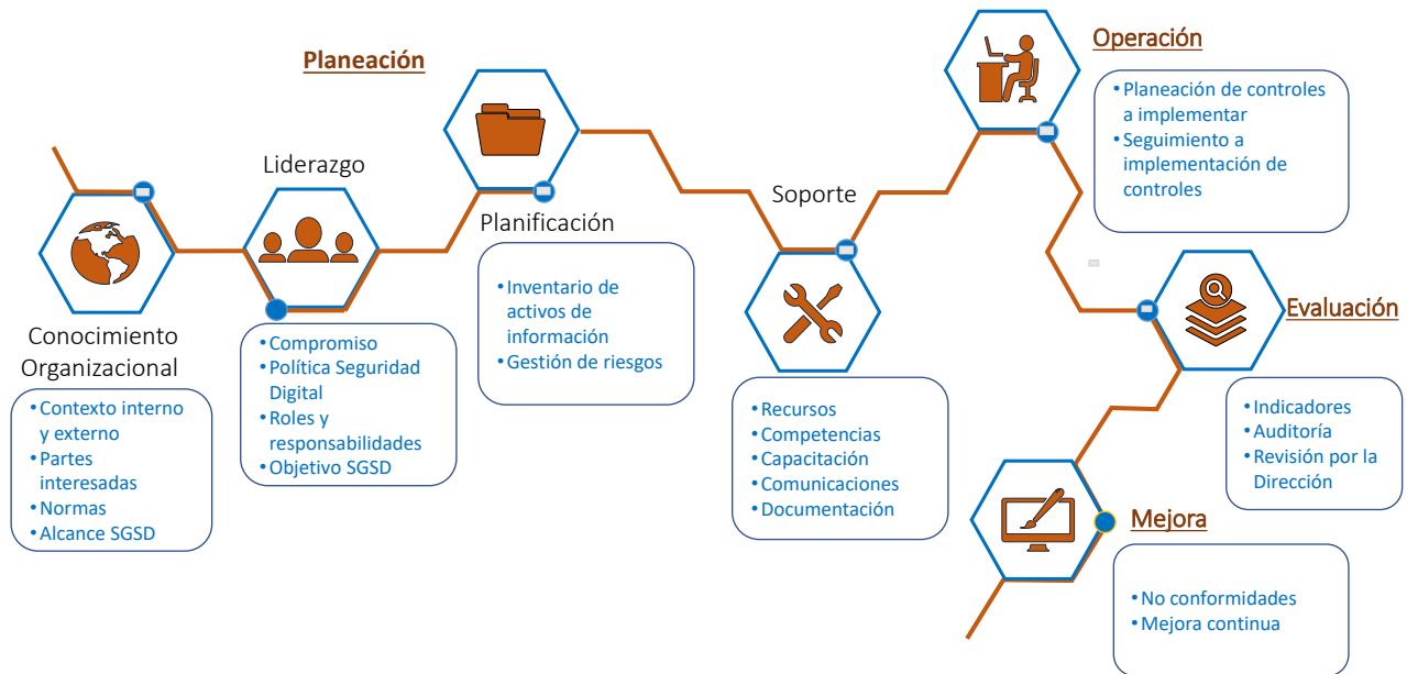
Gráfico 1: Arquitectura del Modelo de Seguridad y Privacidad Digital del Icetex

El Modelo de Seguridad y Privacidad Digital está conformado por los siguientes elementos: