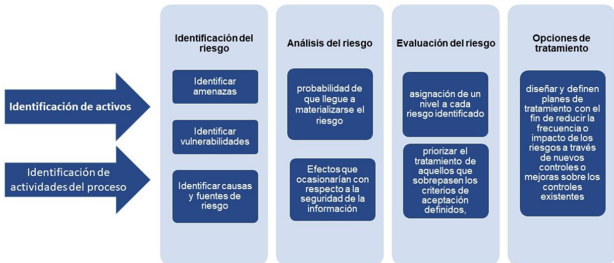
Gráfico 4: Proceso de Gestión de Riesgos de Seguridad Digital

La gestión de riesgos es coordinada por la Oficina de Riesgos y reporta al Comité de Seguridad de la Información los resultados de la gestión, identificación de amenazas, propuestas de mejora y el resumen de los incidentes de seguridad y ciberseguridad. A continuación, se describe el flujo de gestión de riesgos: