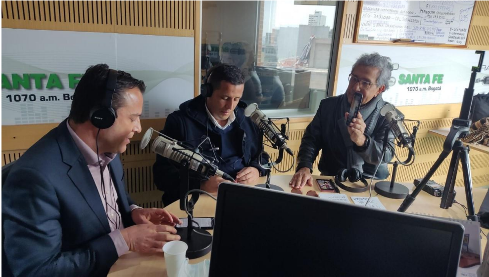
(Voceros de ICETEX en cabina de radio en Radio Santafé 1070AM Bogotá)

Invitaciones previas a participar: (por redes sociales se socializó el programa)