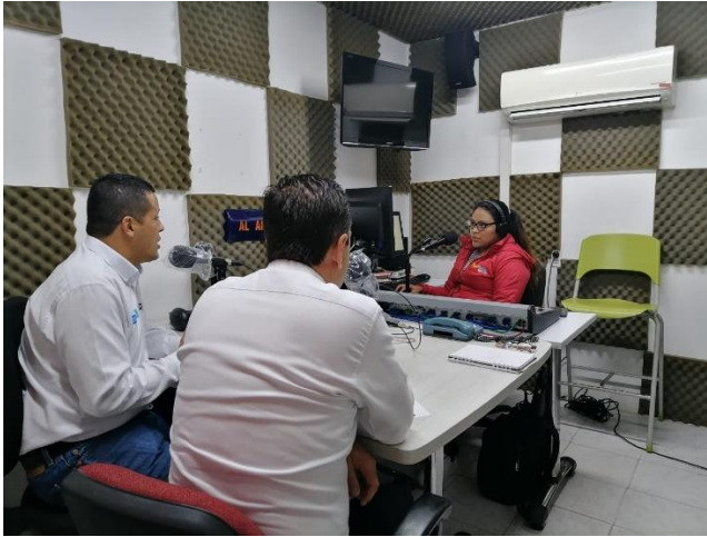
Espacio Regional de Participación Ciudadana, Tropicana Bucaramanga, 18 de mayo de 2022