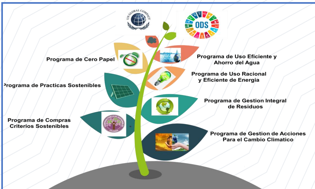
Figura No. 3 Plan de Gestión Ambiental Institucional

El Instituto Colombiano de Crédito Educativo y Estudios en el Exterior – ICETEX, a través de la formulación, implementación y mejora continua del Plan de Gestión Ambiental Institucional (PGAI) busca promover y mejorar el desempeño ambiental del Instituto, con una base sólida en su Política Ambiental Institucional se encamina al mejoramiento continuo de los procesos que se realizan en el ICETEX. El Plan de Gestión Ambiental Institucional (PGAI) contempla programas en materia ambiental de diferente ámbito, que para la actividad del Instituto están implícitas en su operación. Por esta razón, el Plan fundamenta objetivos para el adecuado manejo en la gestión de residuos, ahorro y uso eficiente de agua y energía, criterios ambientales en la gestión contractual y acciones para la gestión del cambio climático. A continuación, se describe la ficha técnica general de cada uno de los programas: