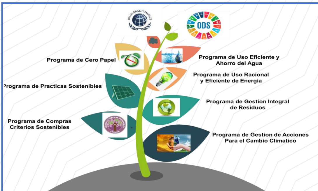
Figura No. 3 Plan de Gestión Ambiental Institucional

El Instituto Colombiano de Crédito Educativo y Estudios en el Exterior – ICETEX, a través de la formulación, implementación y mejora continua del Plan de Gestión Ambiental Institucional (PGAI) busca promover y mejorar el desempeño ambiental del Instituto, con una base sólida en su Política Ambiental Institucional se encamina al mejoramiento continuo de los procesos que se realizan en el ICETEX. El Plan de Gestión Ambiental Institucional (PGAI) contempla programas en materia ambiental de diferente ámbito, que para la actividad del Instituto están implícitas en su operación. Por esta razón, el Plan fundamenta objetivos para el adecuado manejo en la gestión de residuos, ahorro y uso eficiente de agua y energía, criterios ambientales en la gestión contractual y acciones para la gestión del cambio climático. A continuación, se describe la ficha técnica general de cada uno de los programas: